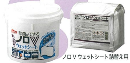
ノロVウェットシート 詰替え用